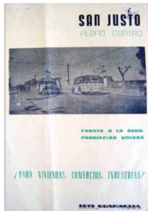
Aviso de loteo en Lomas del Mirador, se observa una foto de la Av. Provincias Unidas (Ruta 3 Km. 12).