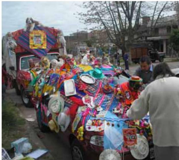
Cargamento en la fiesta de La Virgen de Copacabana