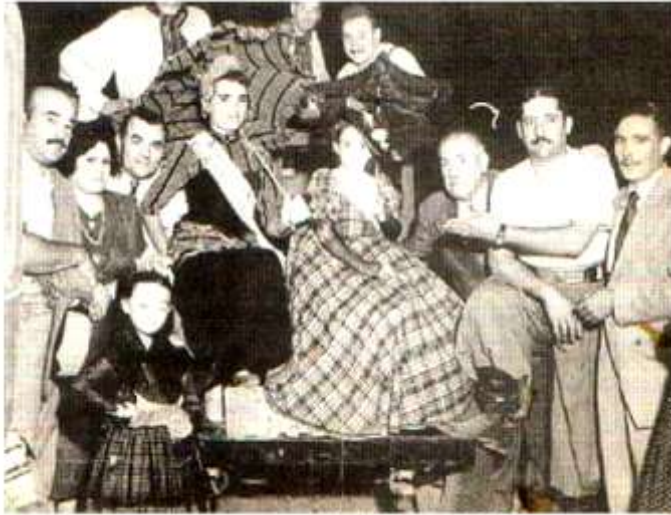
Caravales en Ciudad Evita en 1952.