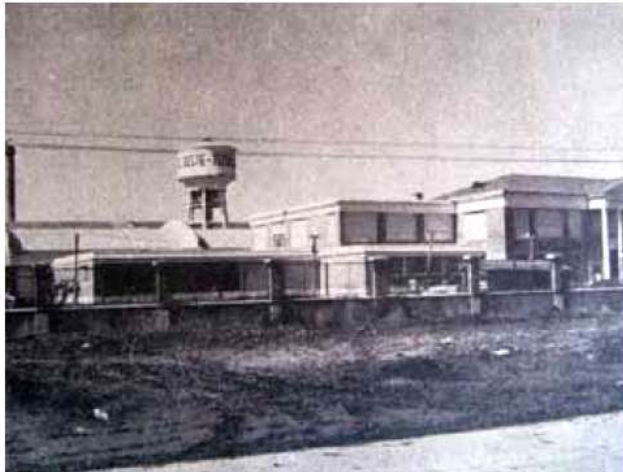
FÁBRICA TEXTIL OESTE

Frente de la Fábrica Textil Oeste, sobre la antigua Av. Provincias Unidas. Esta fábrica dejó de funcionar en 1991. Estaba ubicada en el predio donde actualmente se erige el hipermercado Wall Mart y el nuevo Shopping de San Justo y albergó durante muchísimos años a miles de trabajadores. En la época de máximo esplendor, cobijó a más tres mil obreros, y a finales de la década del '80, cuando el número se había reducido a cerca de quinientos, la industria presentó quiebra. Desde ese momento los trabajadores comenzaron a desandar el duro camino de querer cobrar sus indemnizaciones.