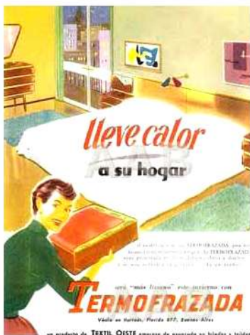
Publicidad de la famosa termofrazada fabricada por la Textil Oeste

Esta tradicional fábrica de sebo y jabón nació a principios del siglo pasado, en 1917 comenzó la construcción de su edificio en Av. Campana y Circunvalación. Primero se llamó La Nacional. Ya con el rosista nombre de Federal supo auspiciar audiciones radiofónicas que hicieron historia en los años '30. Durante la Segunda Guerra exportó a Alemania glicerina para la fabricación de dinamita. Fue intervenida por el entonces militar en ascenso Roberto Viola en épocas del GOU (1943) y durante la dictadura del '76 algunos de sus trabajadores pasaron a las listas de desaparecidos. En 1997, El Nuevo Federal fue vendido a la norteamericana Dial y en 2003 desembarcó en la planta de San Justo The Value Brand (TVB), una de las empresas del grupo de inversión Southern Cross.