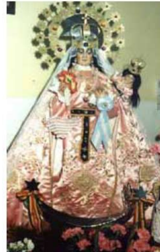
Imágenes de las Virgenes de Urcupiña y de Copacabana

La fiesta comienza con la celebración de una misa en la Capilla San Antonio de Padua, por la mañana del domingo. Continúa con la procesión y luego se desarrolla el festival en el que participan numerosas agrupaciones de baile, provenientes de diferentes localidades. La Misa: es en homenaje a la Virgen pero además en memoria de los difuntos. El sacerdote pide "por los que migran, los difuntos, los que no tienen trabajo". La Procesión: finalizada la misa se da comienzo a la procesión que recorre las calles del barrio. Festival: los grupos avanzan con la procesión danzando. Al llegar al local donde se realizará la fiesta se deja la imagen de la Virgen, que una vez finalizado dicho evento, quedará en manos de los "pasantes" (matrimonio que se responsabiliza de todos los aspectos de la organización de la fiesta y tienen la imagen en su casa hasta el próximo año).