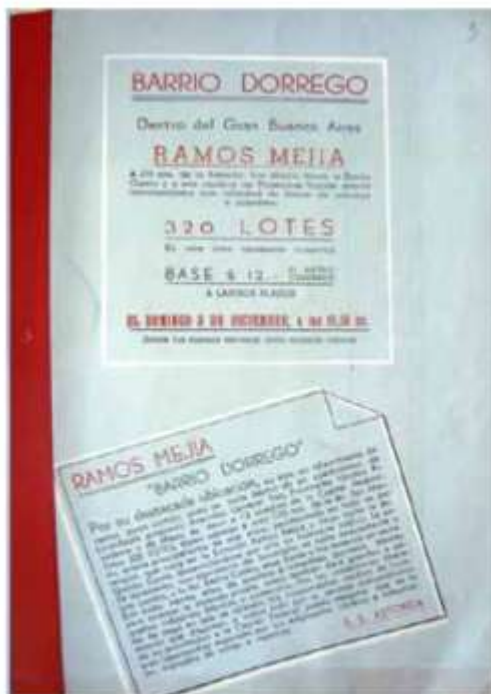
Aviso de remate de la firma Astorga de 1950. Corresponde a terrenos cercanos a la Av. San Martín y Emilio Castro (Actual Mosconi)