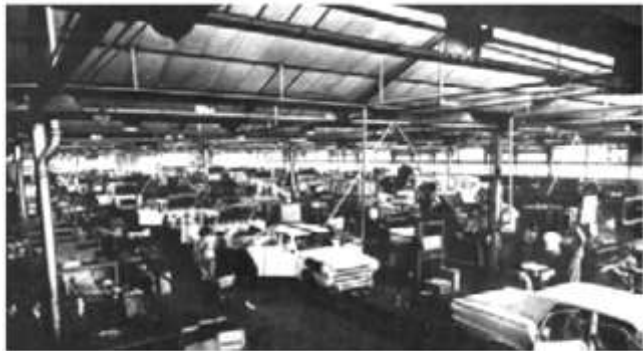
Linea de montaje de la fábrica Chrysler de San Justo a mediados de la década de 1960. Se observa la fabricación del mítico Valliant III.

En San Justo se encontraban diferentes establecimientos, desde industrias medianas hasta importantes establecimientos fabriles, con mucha producción y personal. Por esa época funcionaban establecimientos como: la Textil Oeste, la metalúrgica Santa Rosa, la fábrica de heladeras Siam y la automotriz Chrysler.