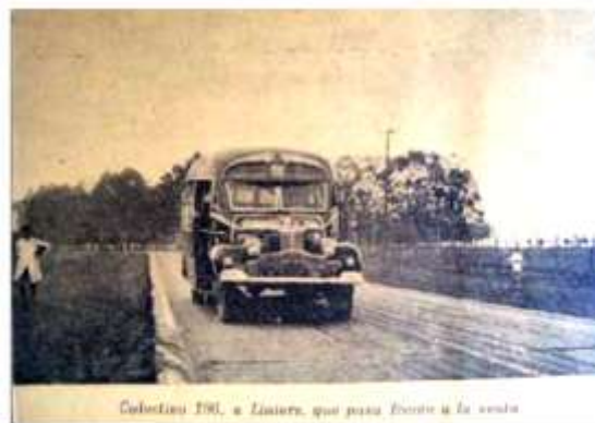
La Ruta 3 a la altura del Km. 23, la foto muestra el colectivo 196 resaltando la existencia de transporte en la zona (años 1949 – 1950) AHMLM