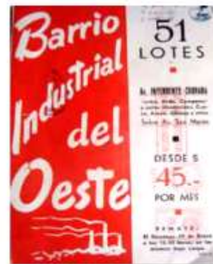
Aviso de loteos en la zona de Tablada. Obsérvese el hincapié que se hace en el desarrollo industrial de la zona, en la cual se asentaba la fábrica de Jabón Federal.