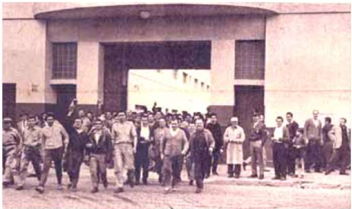
Salida de los obreros de la fábrica Textil Danubio, situada en la calle Rondeau 900 de Ramos Mejía. Donde Trabajaban 1750 personas. (Foto de 1964, Archivo de Junta de Estudios Históricos de la UNLaM)

Volviendo al tema fabril la hilandería Danubio S.A. que aún funcionaba en la década del sesenta fue la mayor empresa del momento y la que ocupaba más cantidad de personal, se destacaba también en esos años la hilandería San Marcos y la empresa metalúrgica Indurcia.