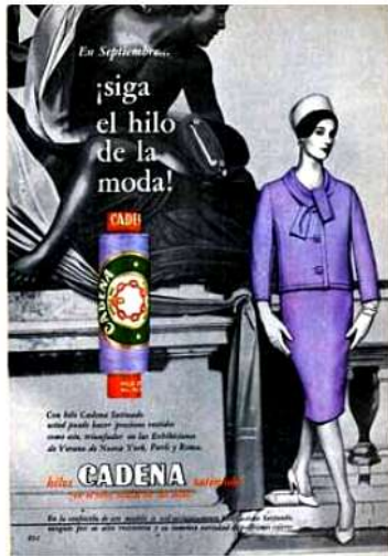
Publicidad de "Hilos Cadena" de la década del '60.

Incluso, generalmente, los departamentos de personal identificaban al trabajo femenino con el manejo del tendido y sectores de hilandería, en donde se necesitaba más precisión y cuidado del hilo para que éste no se cortase dentro de las máquinas. Como además la máquina medía cierta extensión, y cada trabajadora industrial estaba encargada de cada una; se precisaba de mucha atención, y se sufría una gran tensión a la vez.