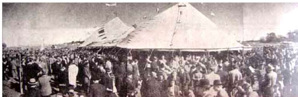
Los loteos: se realizaban en carpas como las de la foto. Las firmas de rematadores en muchos casos facilitaban el transporte hasta el lugar a los interesados, los plazos de venta eran extensos hasta 136 meses. Algunas compañías aseguraban al comprador la entrega de ladrillos para que comience a construir su casa, otras otorgaban préstamos para la compra de materiales de construcción. Esto permitió a muchos trabajadores acceder a una vivienda propia.

Torres 7 sostiene que en las décadas del cuarenta y del cincuenta, se realizó una progresiva ocupación del espacio suburbano. El desarrollo de los barrios nacidos por fraccionamientos y loteos económicos estuvo en aquella época asociado a los nuevos lugares de trabajo, como las fábricas, hecho que se complementó por la aparición y difusión del uso masivo del colectivo.