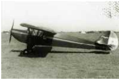
El Boyero aeronave de fabricación nacional

legendarios Piper PA-11 y se asignan a esta institución mecánicos e instructores subvencionados por el Estado, iniciándose de esta manera una gloriosa etapa en la aviación argentina, creadora de una verdadera conciencia aeronáutica en la población. En esos años también formaban parte de la flota del A.C.A. los conocidos Focke Wulf 44, Aeronca Champion, Fleet Canuck, Miles Magister y El Boyero de fabricación nacional.