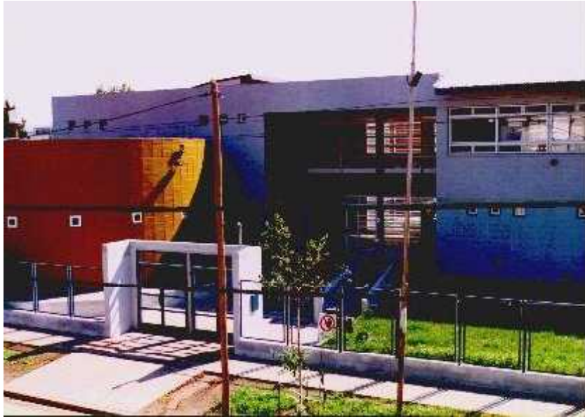
Escuela Media ubicada en Gregorio de Laferrere

Frente a esta oferta de establecimientos educativos es coherente preguntar el nivel educativo alcanzado por la población de la localidad, sin embargo no contamos con información actualizada para dar una respuesta satisfactoria. Los datos más cercanos al tiempo presente, corresponden a los relevados en el Censo Nacional de 1991, y que pueden observarse en el cuadro de población de y mayor a los 5 años incluido a continuación.