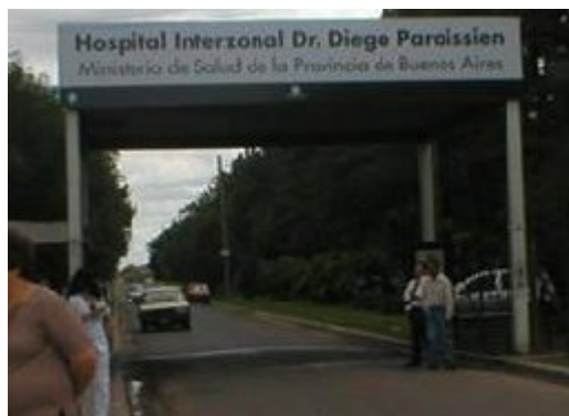
Entrada al Hospital Provincial Diego Paroissien

Durante el gobierno provincial de facto de Ibérico Saint Jean se erige el Hospital Provincial Paroissien, aunque en sus inicios no disponía de equipamiento ni comodidades adecuadas para su funcionamiento. Su diseño habría estado vinculado a la hipótesis