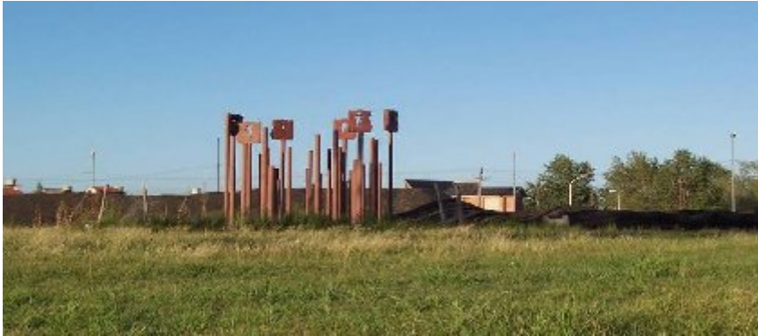
Monumento homenaje a los desaparecidos: 30.000 Mundos

Cintura (Ruta Provincial N° 4) en su intersección con la Autopista Ricchieri.