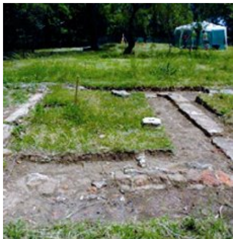
Restos del Vesubio luego de su demolición

Algunas personas que aparecieron acribilladas en Monte Grande en 1977, fueron mostradas por los represores como bajas de enfrentamientos armados, pero en realidad se trató de simulacros. Estos hechos, que se encuentran documentados remiten a personas vistas por última vez como detenidas en El Vesubio.