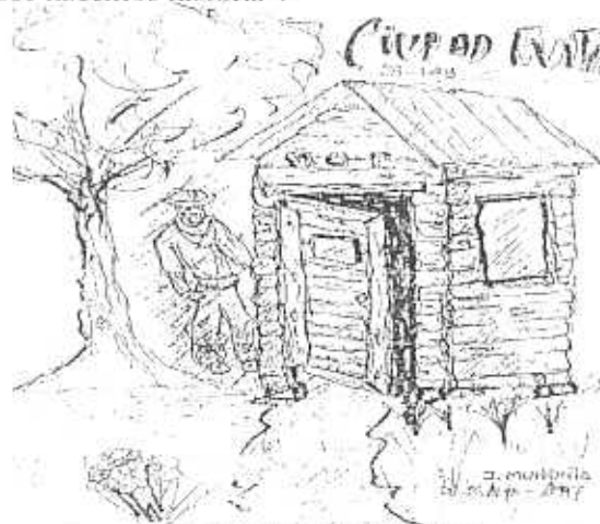
PRIMER SERENO DE LAS OBRAS

Por eso invitamos desde aquí a tomar conciencia de que somos seres históricos y desde allí actuar cotidianamente conservando y haciendo conservar nuestro patrimonio porque "desde la acción o la omisión todos hacemos historia".