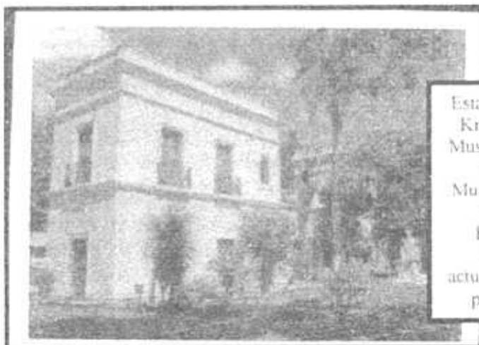
Estancia El Pino Km 40-Ruta 3 Museo y Archivo Historico Municipal de La Matanza El archivo funciona actualmente en el primer piso

También correspondiente al juzgado de paz, existe un libro de asiento de contratos y sucesiones pertenecientes a los años 1872 y 1873. Este libro aun no fue catalogado por encontrarse en vias de restauración: