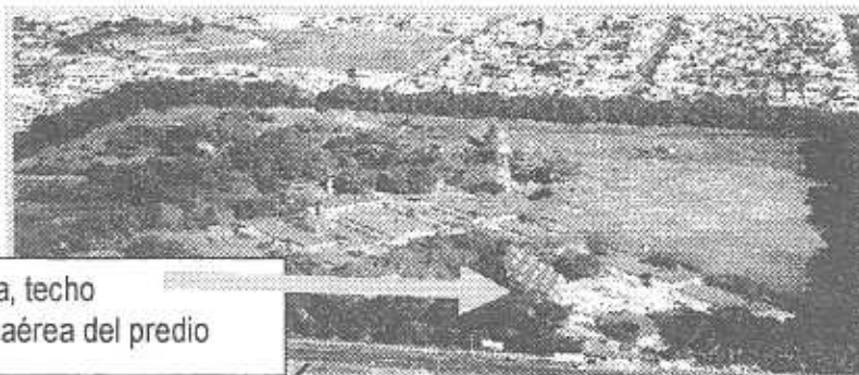
Capilla, techo Vista aérea del predio

Si se observa la vista aérea del lugar, en medio de la edificación puede apreciarse el techo especial de esta capilla. 2